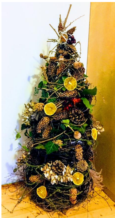
2. místo