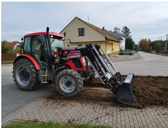
Obr. 1 Nejprve bylo nutné plochu nakypřit a odstranit přebytečnou zeminu.