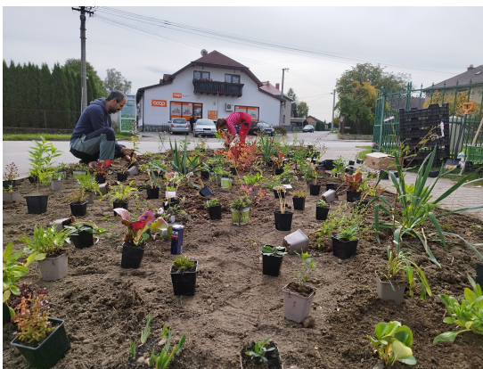
Obr. 2 Následně byly rozmístěny předpěstované sazenice podle jejich funkce ve směsi (viz Tab. 1) a vysazeny.