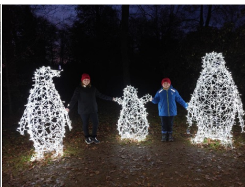
4. místo