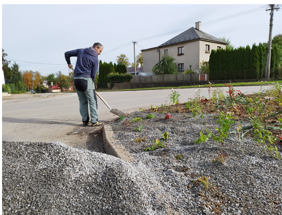
Obr. 3 Nakonec byl celý záhon zasypan štěrkem bránící vysychání a klíčení plevelů.